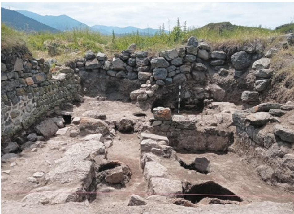
Նկ. 5. Առաջին բաղնիքին կից կառույցը՝ ջրուղիներով և վառարաններով

Այս տարածքում բավականին ընդարձակ կառույց է եղել (4.94×13.3 սմ), որի՝ ցածրիկ պատերով բաժանված ենթաբաժիններում բացվում են մեծաքանակ օջախ-վառարաններ: Դրանցից մեկը բացվեց կառույցի արևմտյան եզրին մոտ: Այն լավ պահպանված վիճակում է, ունի 43 սմ տրամագիծ և 28 սմ խորություն: Եվս չորսը բացվեցին իրար կից՝ մի ուղղանկյուն հատակագծով, փոքր բաժանմունքում, որի պատերը կրասվաղված և անջրաթափանց են եղել: Այս վառարաններն ունեն 60–75 սմ տրամագիծ և մոտ 25–40 սմ բարձրություն: Ինչպես հայտնի է, մետաղյա կաթսաները սովորաբար դրվում էին խցերի հատակի տակ, խարույկի վրա (Անի, Անբերդ) (Aleksanyan, 2010, 19) և չի բացատրվում, որ այստեղ մենք գործ ունենք նման խցի հետ: Ակնհայտ է, որ այս տարածքը օգտագործվել է ջրի