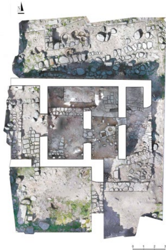
նկ.1. Առաջին բաղնիքի հատակագիծը և իրավիճակը պեղումների ավարտին (Գծ. Հ. Սանամյանի, Ա. Սարգսյանի)

Առհասարակ բաղնիքի ներսույթի I շերտի պեղումները բավականին արդյունավետ էին. հայտնաբերվեցին մեծ թվով խեցեղեն, կենդանիների ոսկորներ, ձիասանձի լկամ, քարե և ապակե ուլունքներ և այլ առարկաներ, իսկ բաղնիքի արևելյան պատի մոտ բացվեց 40 սմ տրամագծով, կավե պատերով օջախ: Այն ունի 20 սմ բարձրություն և 5,5 սմ պատերի հաստություն: Հատակը կրասավաղ է: Օջախին կից բացվեց 4 սալաքարերով շարված ուղղանկյուն հոր (44x40 սմ): Մեր կարծիքով օջախին կից գտնվող այս հորը նախատեսված էր դրանում լցված ջուրը տաք պահելու նպատակով: Նման սալաքարերով քառակուսի հոր հայտնաբերվել է նաև Դաշտադենի ամրոցի պեղումների ժամանակ, որը, նույնպես կից է շրջանաձև օջախին (ըստ հնագետ Ա. Բաբաջանյանի՝ Դաշտադենի պեղումներով բացվածը վառարան է, որն ամբողջությամբ լցված է եղել մոխրով): Հորի մոտից գտնվեցին մի քանի պղնձե անոթների բեկորներ և կիսով չափ պահպանված կավե ջրաման (15 սմ բարձր., 6.5 սմ բերանի բացվածք, կանթի բարձր.՝ 8 սմ, կանթի հաստ.՝ 1.5 սմ) (նկ.9/1): Այս փոքր չափերով անոթն ունի ուռուցիկ իրան, նեղ վզիկ, դուրս փոված շուրթ և մեկ աղեղնաձև կանթ: Նմանատիպ նուրբ խեցիով ջրամաններից ամենախոշորները 2-3 լիտր տարողությամբ են լինում, որոնք հաճախ պատված են լինում անգործով կամ ներկված լինում կարմրավուն ներկով, ապա փայլեցվում (Arakelyan, 1958, 221): Հարկ է նշել, որ քարե տաշտերից ջուրը վերցվել է կավե կամ պղնձե ամաններով (Gharibyan, 2000, 105): Պեղումները ցույց տվեցին, որ I շերտը ուշ շրջանում՝ հավանաբար 14-15-րդ դդ., մանր քարերով (նաև կոթողների բեկորներով) կրաշաղախով տոփանված հատակ է: