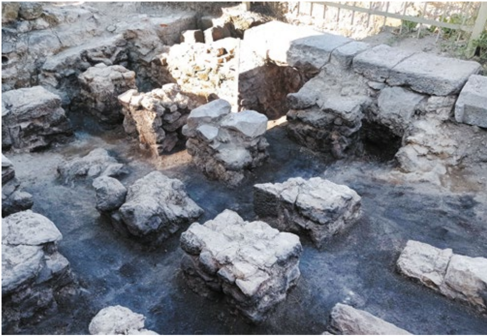
Նկ.7. Երկրորդ բաղնիքի լողասրահում բացված հիպոկաուստ հատակի հենասյուները

բարձր է բաղնիքի մյուս կառույցների համեմատ: Այս հատվածը Ղարիբյանի ղեկավարած արշավախումբը պեղել է ջեռոցը հայտնաբերելու անկալիքով: Ըստ Ղարիբյանի՝ կառուցն ունեցել է գմբեթաձև ծածկ, և ենթադրում, որ ծածկի միջից կարող էր ջրամբարը մաքրելու նպատակով արված մուտք լինել: Արևելյան պատը շարված է ժայռի կից: Հատակը սալարկված է դեղնավուն ֆելզիտով, արանքները լրացված են կրաշաղախով: Այս կառույցից 17 սմ տրամագիծ ունեցող կավե խողովակաշարով ջուրը հոսել է այժմ կանգուն թաղով բաժանմունքը: Նույն՝ հարավ-արևելյան կիսաքանդ անկյունի լիցքի մեջ բացվել են 8.5 սմ տրամագծով մի քանի խողովակաշար ևս: