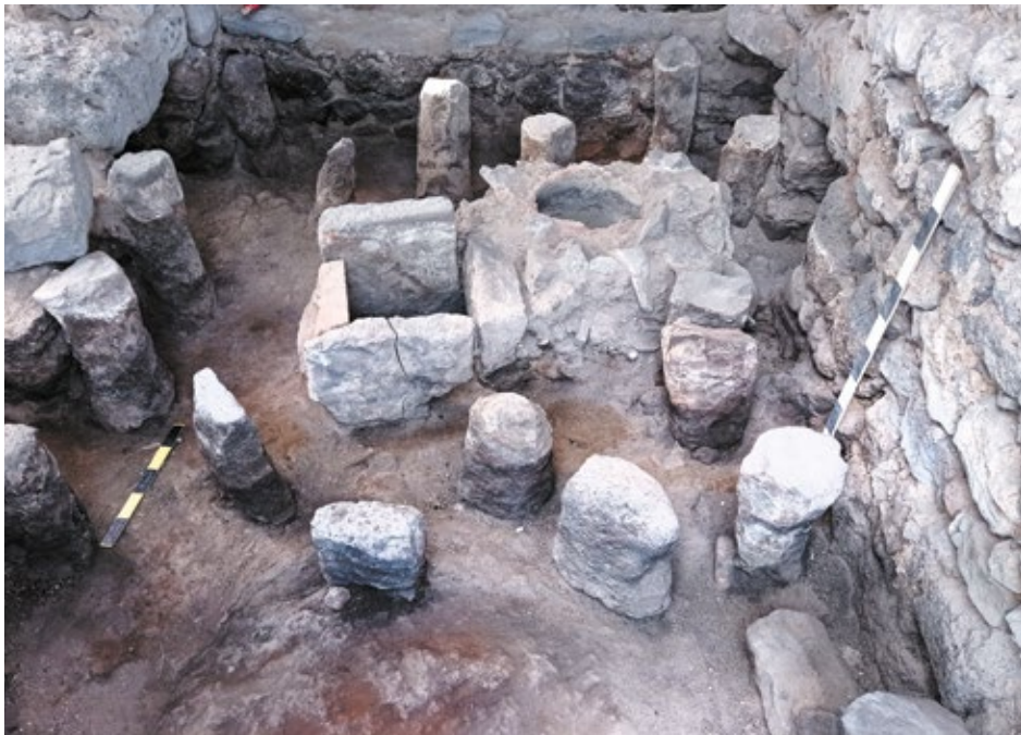
Նկ. 3. Առաջին բաղնիքի լողասրահում բացված հիպոկաուստ հատակի հենասյուները

լայնքով), որով, փաստորեն, եռացած գոլորշին արևելյան բաժնից անցել է արևմտյան բաժին: