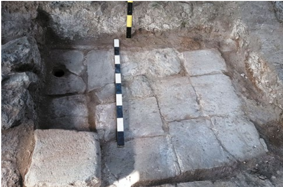
Նկ. 2. Առաջին բաղնիքի ներսում բացված ջրավազան