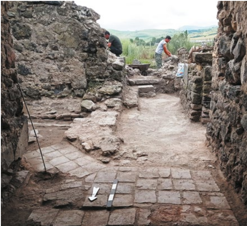
նկ. 8. Երկրորդ բաղնիքի ներսում բացված թրժած աղյուսներով հատակը

րը: Այն, կարելի է ասել, ամբողջությամբ թաղված է եղել կրաշաղախի մեջ: Այս նույն անկյունում հայտնաբերվեց պատի միջով անցնող օդամուղ անցքը, որի միջոցով հատակի տակի եռացրած գոլորշին դուրս է մղվել: