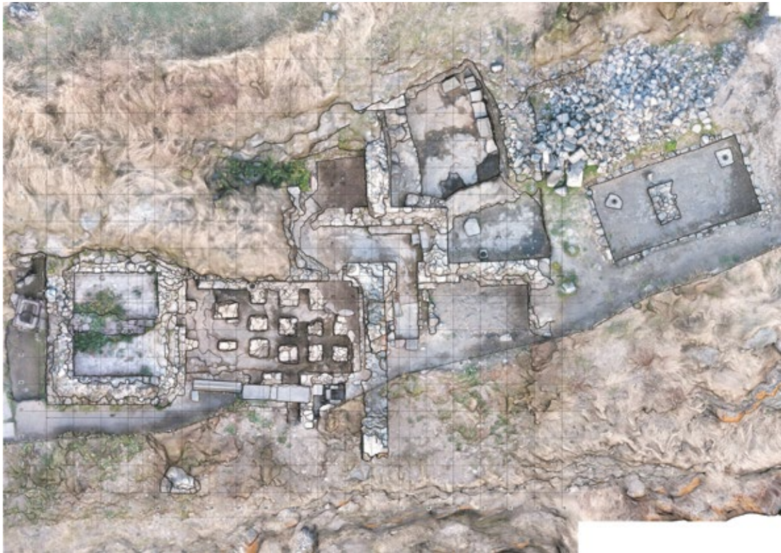
Նկ. 6. Երկրորդ բաղնիքի հատակագիծը (Գծ. Գ. Գյուլամիրյանի, Ն. Քալանթարյանի)

ընդհակառակը, բաղնիքի պատերն են հարմարեցված ժայռին: Արևմտյան կողմում բաղնիքի բաժանմունքների մի մասը քանդվել և թափվել է ձորը: